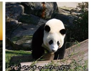
アドベンチャーワールド